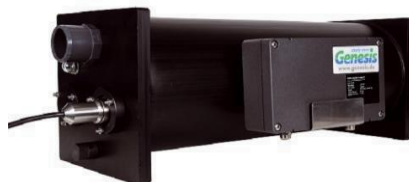
Blue Light PE für EVO Schwerkraft